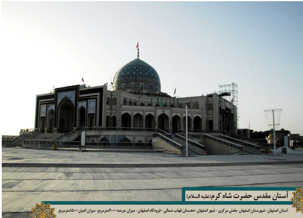
آستان مقدس حضرت شاه کرم (علیه السلام)